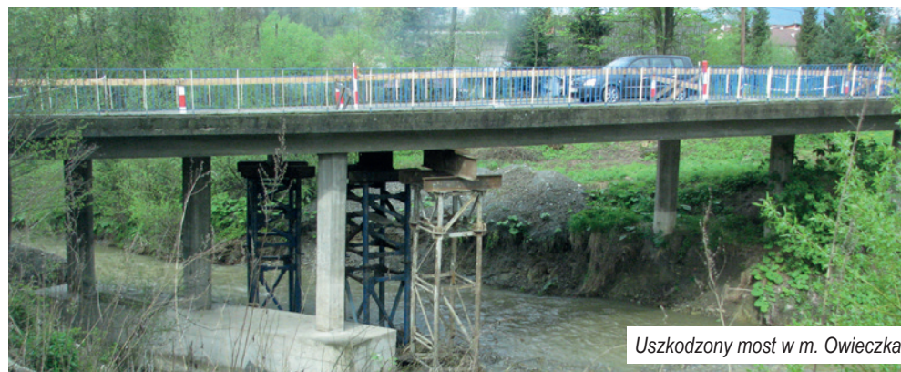
Uszkodzony most w m. Owieczka

wych kosztów realizacji zadania. Jednak w wyniku przeprowadzonego postępowania przetargowego o udzielenie zamówienia publicznego na odbudowę uszkodzonego obiektu, wyłoniona została najkorzystniejsza oferta opiewająca na kwotę w wysokości ponad 6 mln 768 tys. zł., która to wartość znacznie przekroczyła przyjęty pierwotnie szacunkowy koszt realizacji zadania. W wyniku zaistniałej sytuacji kwota przyznanej promesy pokrywała jedynie 70,92 % kosztów kwalifikowanych wobec możliwych do uzyskania 80 % co byłoby równoważne kwocie dofinansowania. Różnica zatem pomiędzy dotacją przyznaną a pożądaną wynosiła 614 tys. 770 zł.