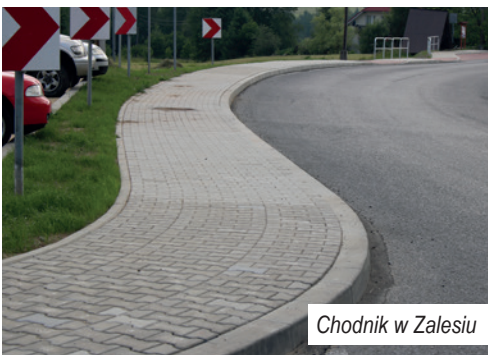
Chodnik w Zalesiu

Przy pozyskanym wsparciu Województwa Małopolskiego planujemy wykonanie nowej nawierzchni na drodze Limanowa-Kamienica o dł. 4 km w Centrum Starej Wsi i na trasie wyścigu górskiego – dodaje dyrektor PZD.