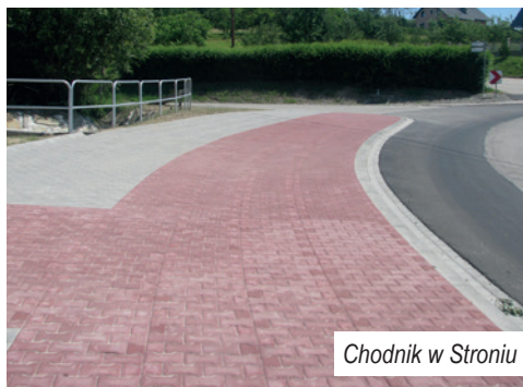
Chodnik w Stroniu