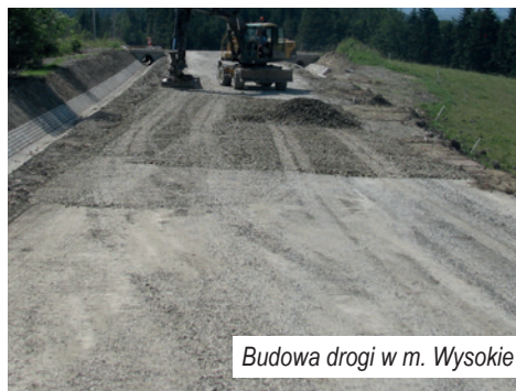
Budowa drogi w m. Wysokie