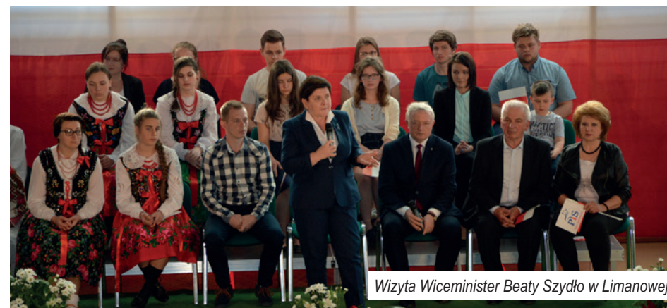
Wizyta Wiceminister Beaty Szydło w Limanowej

Było też wystarczająco dużo czasu, aby powiedzieć o naszych lokalnych planach budowy kolei i lepszych połączeń lokalnych i do Krakowa.