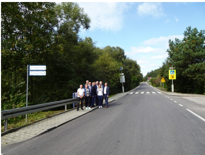
droga 1579K – Przyszowa