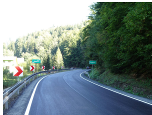
droga 1609K – Zbludza