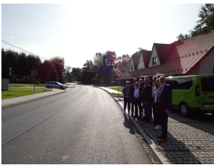
droga 1622K – Szczyrzyc

Remont drogi powiatowej nr 1609 K, nr 1629 K, nr 1622 K w miejscowościach Zalesie/Zbludza, Poręba Wielka (w kierunku Koninek od mostu do wysokości Kościoła), Niedźwiedź (od oś. Spyrki do Szkoły Podstawowej) i Szczyrzyc (centrum) – za łączną kwotę 3 821 875,04 zł (Wykonawca Firma ZIBUD).