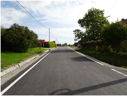
droga 1545K- Stronie