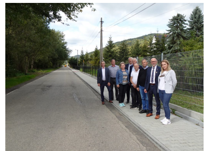
droga 1610K – Łukowica

Remont drogi powiatowej nr 1618 K, nr 1632 K, nr 1622 K, nr 1609 K w miejscowościach Limanowa/Koszary (od wodociągów do granicy z m. Piekiełko), Tymbark (od Podłopienia do skrzyżowania w kierunku Piekiełka), Porąbka (od przystanku BUS powyżej torów kolejowych w kierunku Skrzydłnej), Dobra (od DK 28 do mostu) i Kamienica/Zbludza – za łączną kwotę 5 508 034,99 zł (Wykonawca Firma ZBD Group Nowy Sącz).