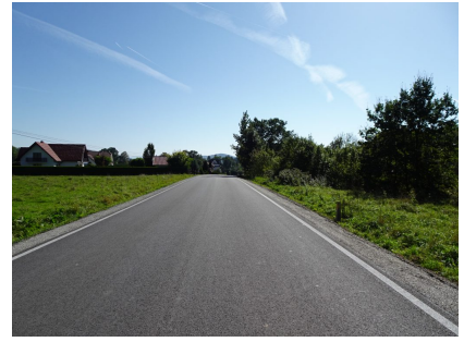
droga 1579K – Przyszowa