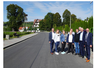
droga 1629K – Poręba Wielka

Zagospodarowanie turystyczne szlaku łączącego Centrum Obsługi Ruchu Turystycznego w Zalesiu z parkingiem przy trasach w kierunku góry Mogielica poprzez wykonanie oświetlenia oraz infrastruktury turystycznej – za łączną kwotę 1 142 379,06 zł (Wykonawca Firma MAXI Bogdan Jędrzejek).