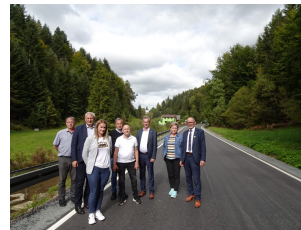
droga 1609K – Zbludza