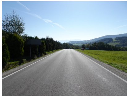
droga 1579K – Siekierczyna