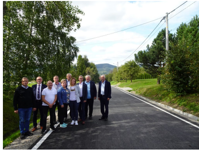
droga 1545K- Stronie