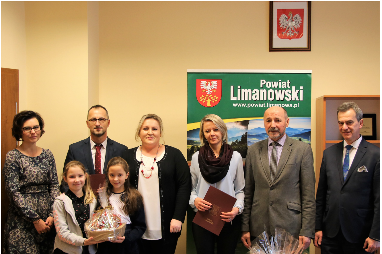
II miejsce – Zespół Szkolno Przedszkolny nr 4 im. Jana z Kęt w Limanowej