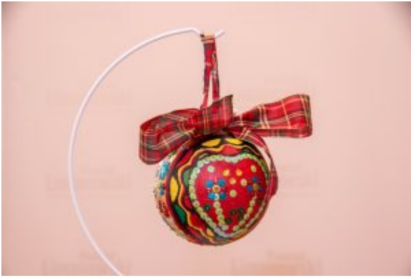
Miejsce III: Emilia Kęska