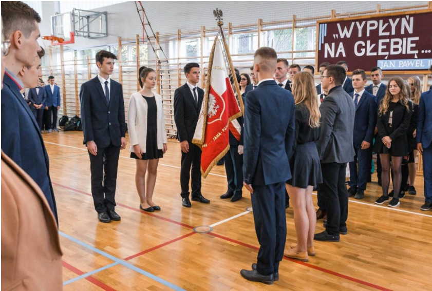
Zespół Szkół Nr 1 w Limanowej GALERIA