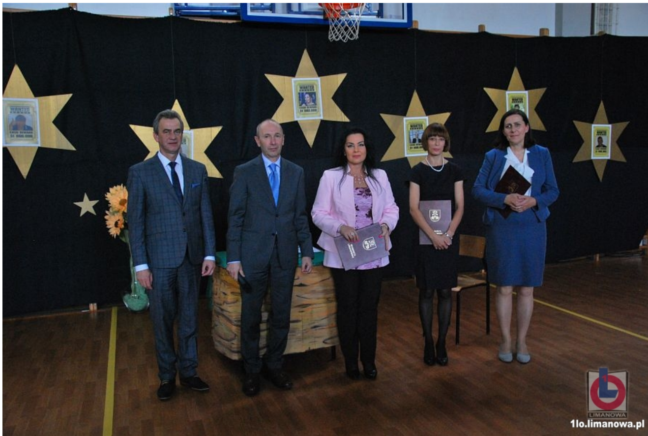
Zespół Szkół Techniczno-Informatycznych w Mszanie Dolnej GALERIA