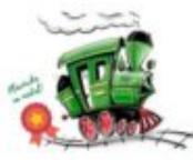
LOKOMOTYWA Miejski Dom w Dobrej w Limanowie