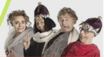
Kabaret Pod Wyrwigroszem