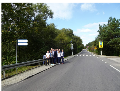
droga 1579K – Przyszowa