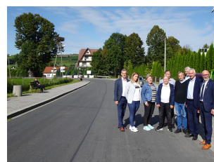
droga 1629K – Poręba Wielka

Zagospodarowanie turystyczne szlaku łączącego Centrum Obsługi Ruchu Turystycznego w Zalesiu z parkingiem przy trasach w kierunku góry Mogielica poprzez wykonanie oświetlenia oraz