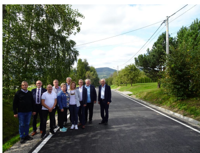
droga 1545K- Stronie