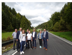
droga 1609K – Zbludza