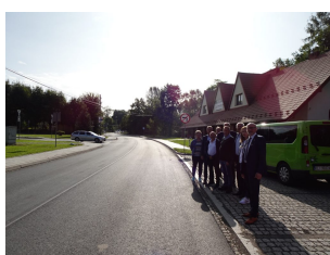
droga 1622K – Szczyrzyc

Remont drogi powiatowej nr 1609 K, nr 1629 K, nr 1622 K w miejscowościach Zalesie/Zbludza, Poręba Wielka (w kierunku Koninek od mostu do wysokości Kościoła), Niedźwiedź (od oś. Spyrki do Szkoły Podstawowej) i Szczyrzyc (centrum) – za łączną kwotę 3 821 875,04 zł (Wykonawca Firma ZIBUD).