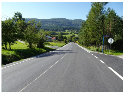
droga 1622K – Porąbka

powyżej torów kolejowych w kierunku Skrzydłnej), Dobra (od DK 28 do mostu) i Kamienica/Zbludza – za łączną kwotę 5 508 034,99 zł (Wykonawca Firma ZBD Group Nowy Sącz).