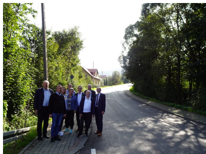
droga 1622K – Dobra

Remont drogi powiatowej nr 1609 K, nr 1629 K, nr 1622 K w miejscowościach Zalesie/Zbludza, Poręba Wielka (w kierunku Koninek od mostu do wysokości Kościoła), Niedźwiedź (od oś. Spyrki do Szkoły Podstawowej) i Szczyrzyc (centrum) – za łączną kwotę 3 821 875,04 zł (Wykonawca Firma ZIBUD).