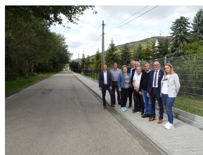
droga 1610K – Łukowica

Remont drogi powiatowej nr 1618 K, nr 1632 K, nr 1622 K, nr 1609 K w miejscowościach Limanowa/Koszary (od wodociągów do granicy z m. Piekiełko), Tymbark (od Podłopienia do skrzyżowania w kierunku Piekiełka), Porąbka (od przystanku BUS