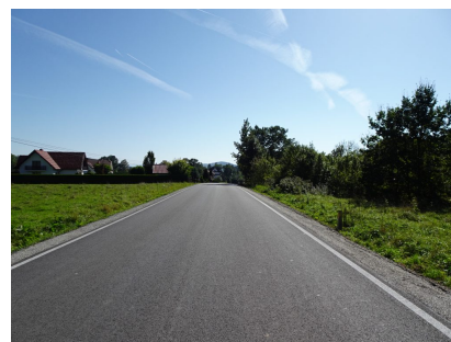
droga 1579K – Przyszowa