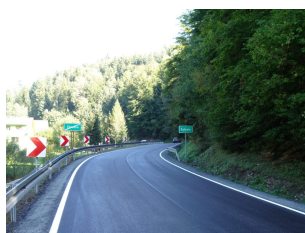
droga 1609K – Zbludza