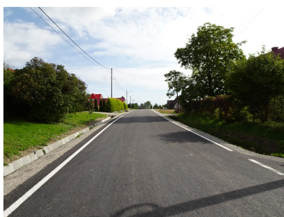
droga 1545K- Stronie

Remont drogi powiatowej nr 1579 K, nr 1545 K, nr 1610 K, nr 1617 K w miejscowościach Kanina/Przyszowa (począwszy od DK 28 do mostu w „Berdychowiu”), Stronie (pogranicze z Powiatem Nowosądeckim w kierunku Mokrej Wsi), Łukowica i Tymbark – za łączną kwotę 5 620 972,57 zł (Wykonawca P.D.M. Limdrog Sp. z o. o.).