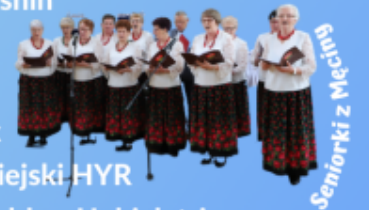
Seniorski z Męciny