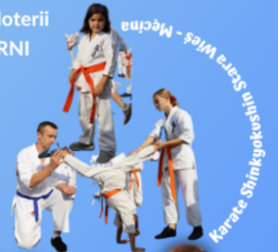
Karate Shinkyokushin Stara Wieś - Męcina