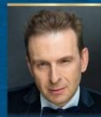
SCENARIUSZ I REŻYSERIA ŁUKASZ LECH