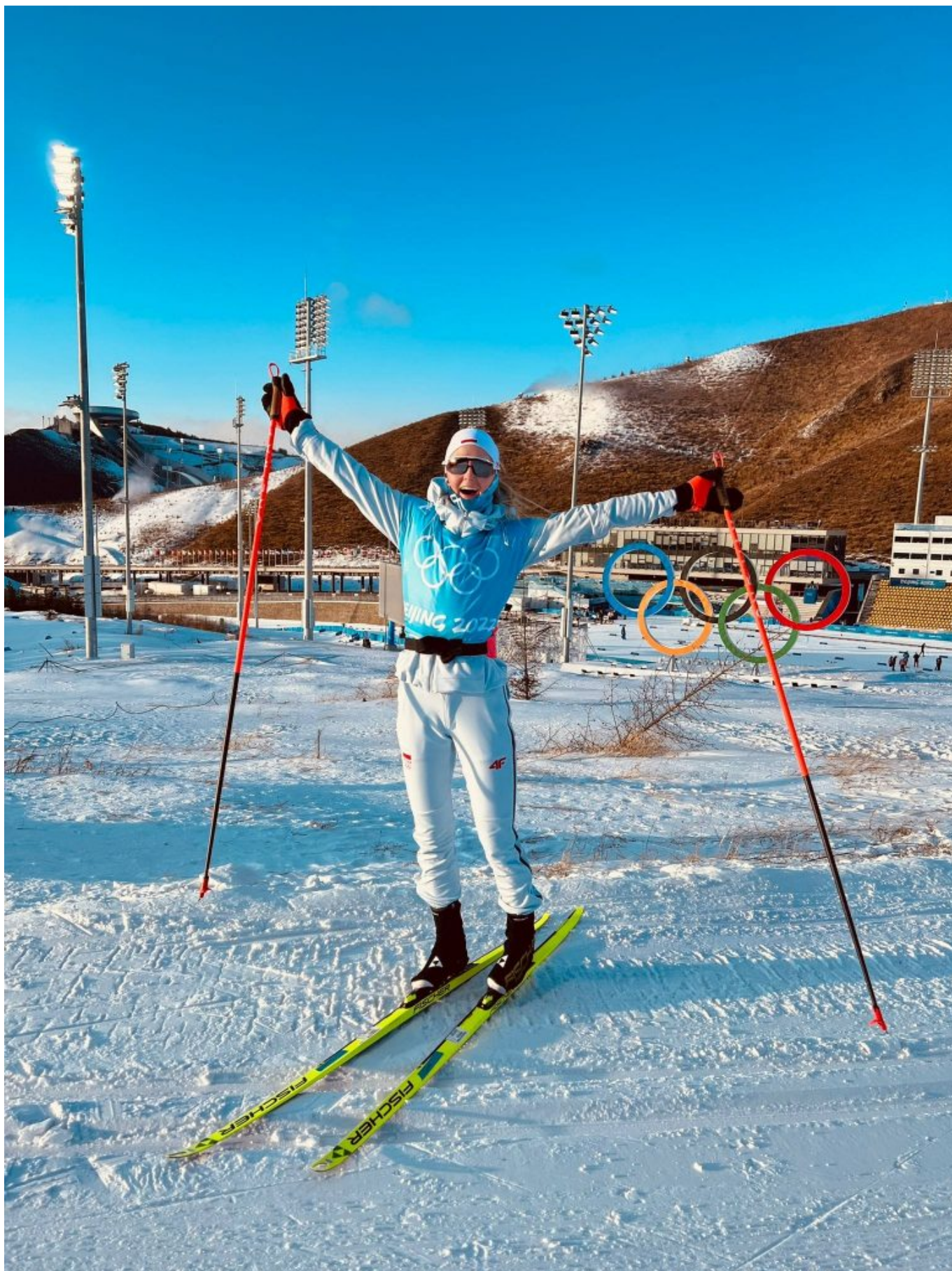
Fot. W.Kaleta, LKS Markam Wiśniowa-Osieczany