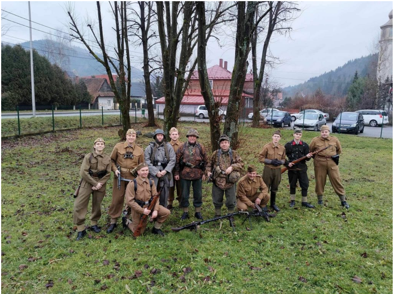
źr. SRH- 1 PSP AK, fot. Szczawa Razem