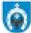
Katedra Inżynierii Geodezyjnej