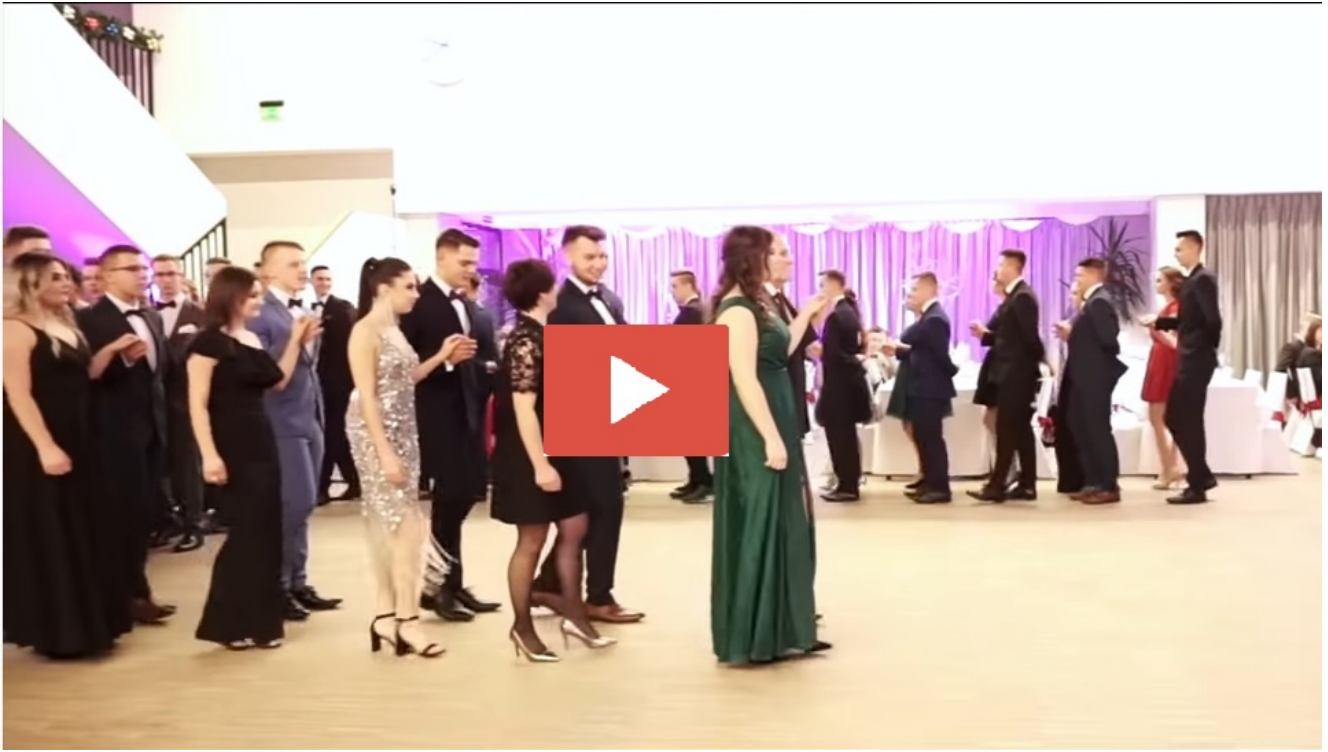
Zespół Szkół im. Komisji Edukacji Narodowej w Tymbarku