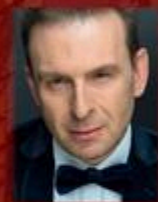
SCENARIUSZ I REŻYSERIA ŁUKASZ LECH

CHÓR MIESZANY CANTICUM IUBILAEUM POD DYREKCJĄ I W OPRACOWANIACH CHÓRALNYCH MARKA MICHALIKA