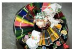
ZESPÓŁ PIEŚNI I TAŃCA AGH KRAKUS