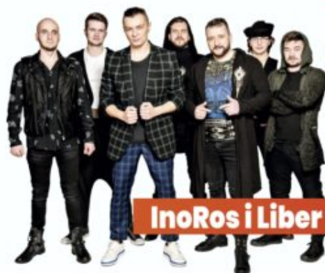
InoRos i Liber