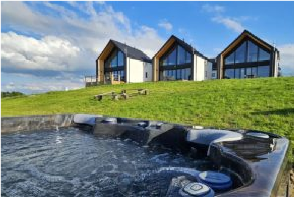
2. Góra Paproć