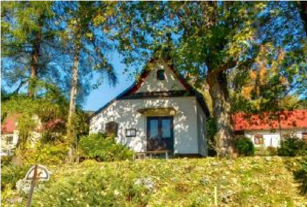
4. Wystawa Przyrodnicza Gorczańskiego Parku Narodowego – Poręba Wielka