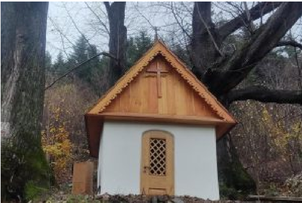
11. Skansen na Jędrzejkówce w Laskowej