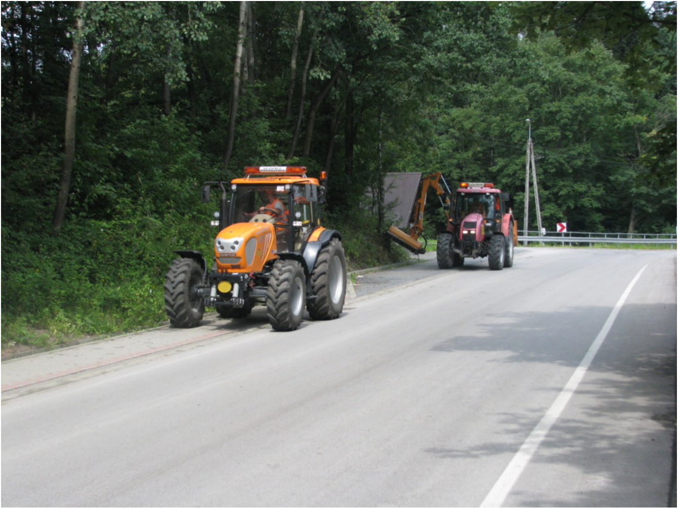
Prace porządkowe Stara Wieś FOT.