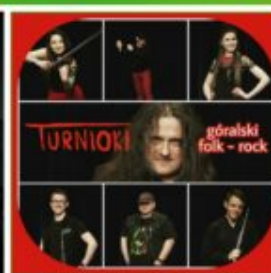
TURNIOKI góralski folk - rock