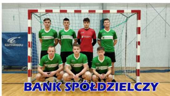
BANK SPÓŁDZIELCZY LIMANOWA