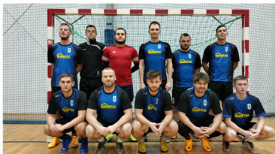
STRADOMKA PIEKNI I MŁODZI