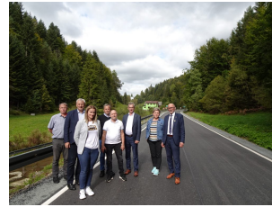
droga 1609K – Zbludza