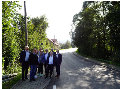
droga 1622K – Dobra

Remont drogi powiatowej nr 1609 K, nr 1629 K, nr 1622 K w miejscowościach Zalesie/Zbludza, Poręba Wielka (w kierunku Koninek od mostu do wysokości Kościoła), Niedźwiedź (od oś. Spyrki do Szkoły Podstawowej) i Szczyrzyc (centrum) – za łączną kwotę 3 821 875,04 zł (Wykonawca Firma ZIBUD).