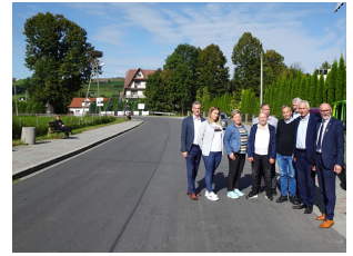
droga 1629K – Poręba Wielka

Zagospodarowanie turystyczne szlaku łączącego Centrum Obsługi Ruchu Turystycznego w Zalesiu z parkingiem przy trasach w kierunku góry Mogielica poprzez wykonanie oświetlenia oraz infrastruktury turystycznej – za łączną kwotę 1 142 379,06 zł (Wykonawca Firma MAXI Bogdan Jędrzejek).