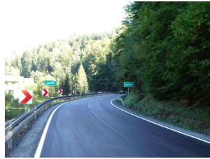
droga 1609K – Zbludza