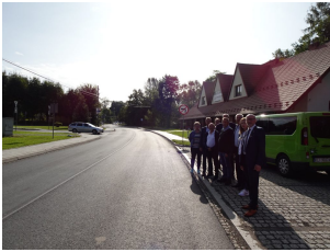
droga 1622K – Szczyrzyc