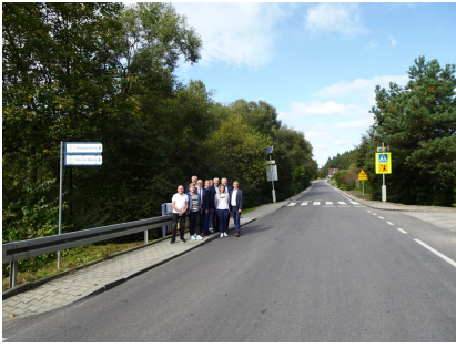
droga 1579K – Przyszowa