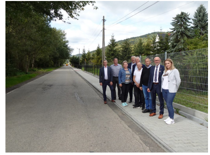
droga 1610K – Łukowica

Remont drogi powiatowej nr 1618 K, nr 1632 K, nr 1622 K, nr 1609 K w miejscowościach Limanowa/Koszary (od wodociągów do granicy z m. Piekiełko), Tymbark (od Podłopienia do skrzyżowania w kierunku Piekiełka), Porąbka (od przystanku BUS powyżej torów kolejowych w kierunku Skrzydłnej), Dobra (od DK 28 do mostu) i Kamienica/Zbludza – za łączną kwotę 5 508 034,99 zł (Wykonawca Firma ZBD Group Nowy Sącz).