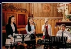
Zespół „Laus Deo” z Podłopienia