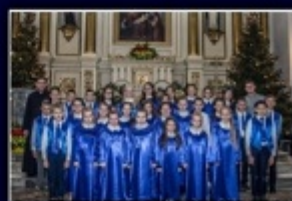
Zespół „Gloria Mariae” z Tymbarku