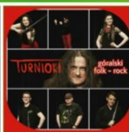
TURNIOKI góralski folk - rock