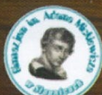
Gimnazjum im. Adama Mickiewicza w Słopnicach