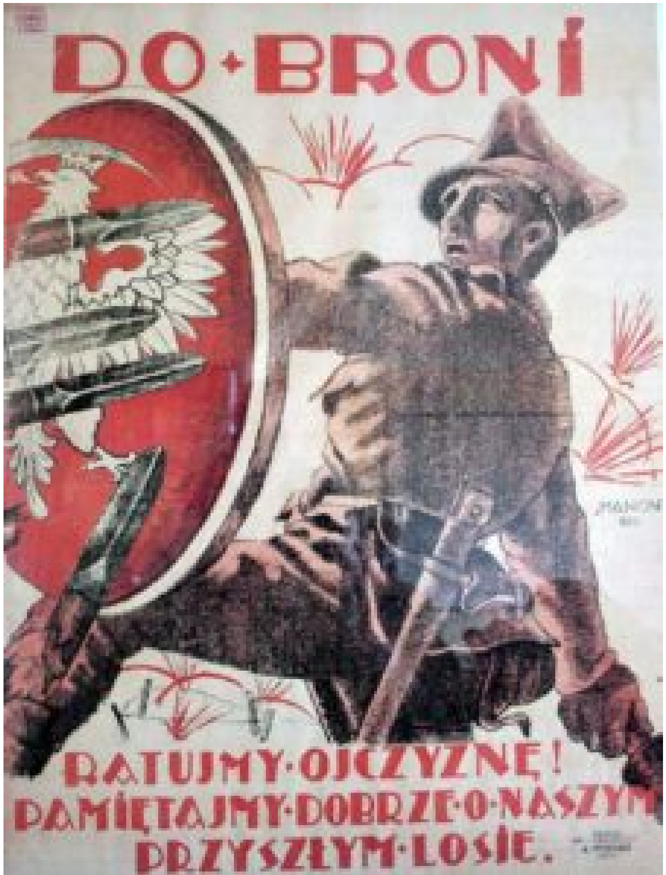
Polski plakat rekrutacyjny z roku 1920