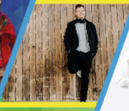
Kabaret POD WYRWIGROSZEM