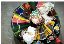
ZESPÓŁ PIEŚNI I TAŃCA AGH KRAKUS