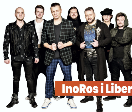
InoRos i Liber