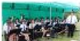
GRUPA WYSTĘPU WITWIE BIEŻOCHÓW