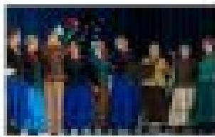
GRUPA WYSTĘPU ŚWIĄTKÓW