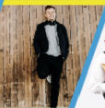
Kabaret POD WYRWIGROSZEM