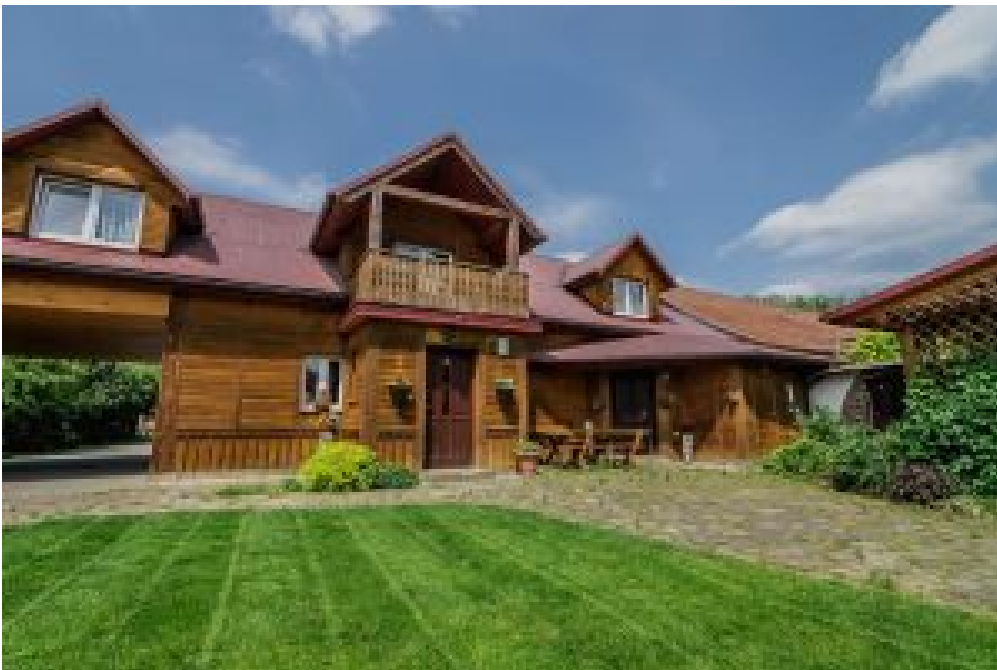
8. Młodzieżowy Ośrodek Rekolekcyjno – Rekreacyjny na Śnieżnicy