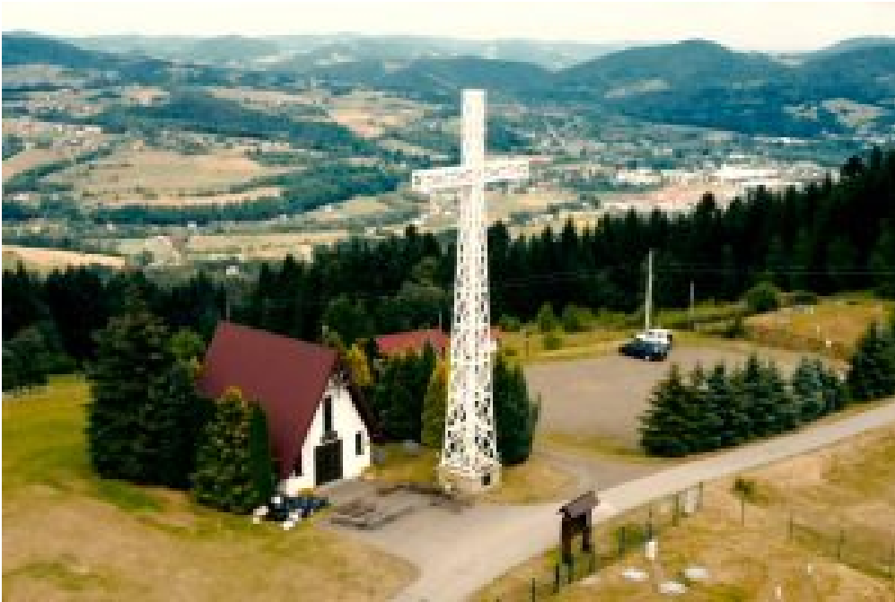
3. Kaplica na Górach, (Kapitanka) – Tymbark