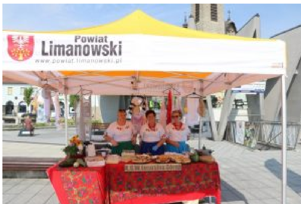
KGW Gosposie z Mszany Górnej