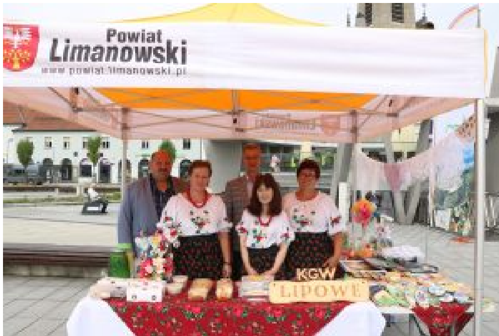
KGW Kamienica Górna