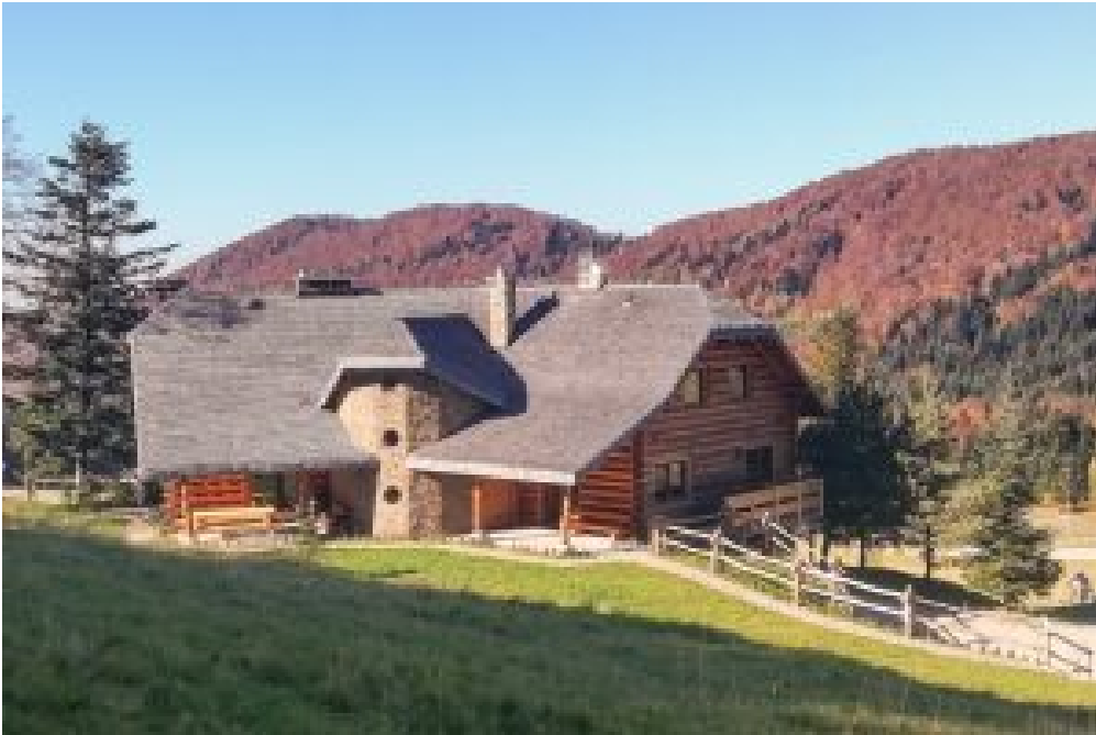
7. Gospodarstwo Agroturystyczne „Za piecem” – Strzeszyce