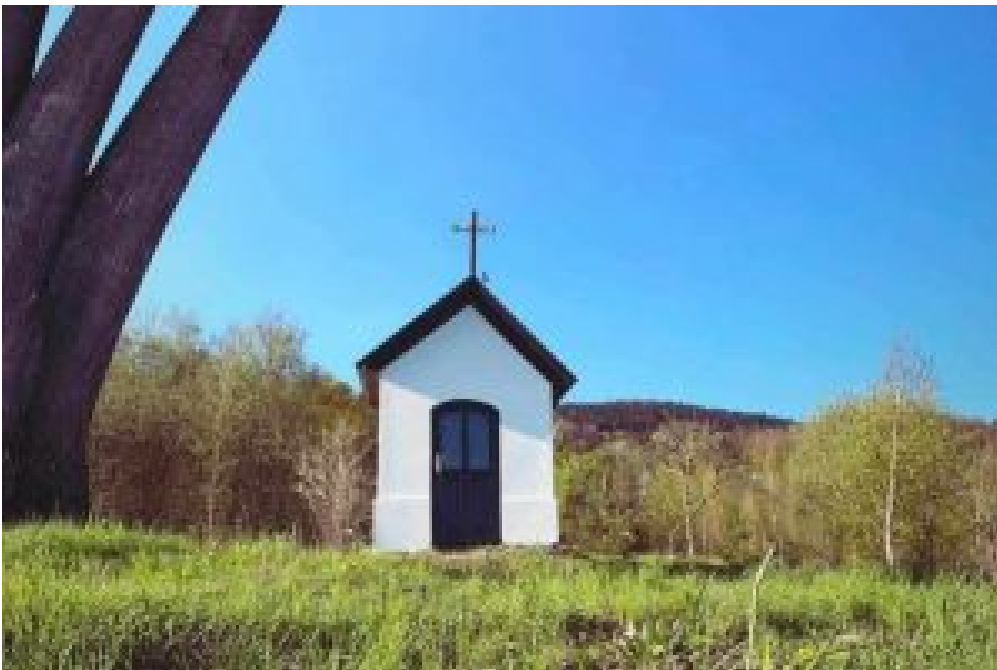
6. Lipowe Wzgórze – Mordarka