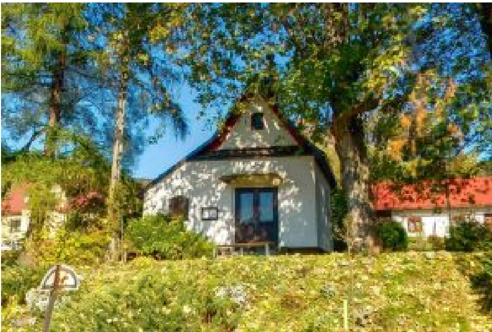
4. Wystawa Przyrodnicza Gorczańskiego Parku Narodowego – Poręba Wielka