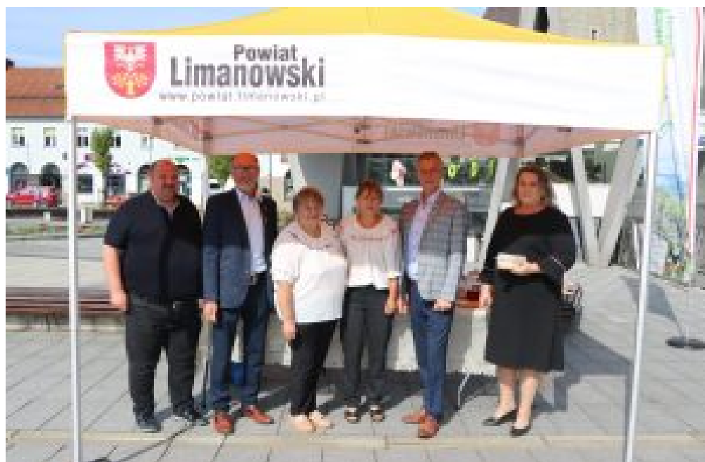
KGW Łososina Górna