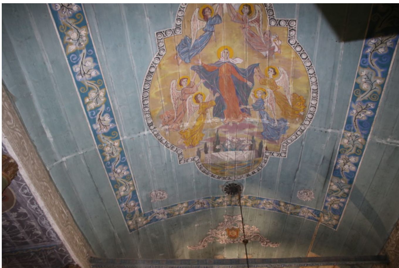
Parafia pw. Św. Antoniego Opata w Męcinie,