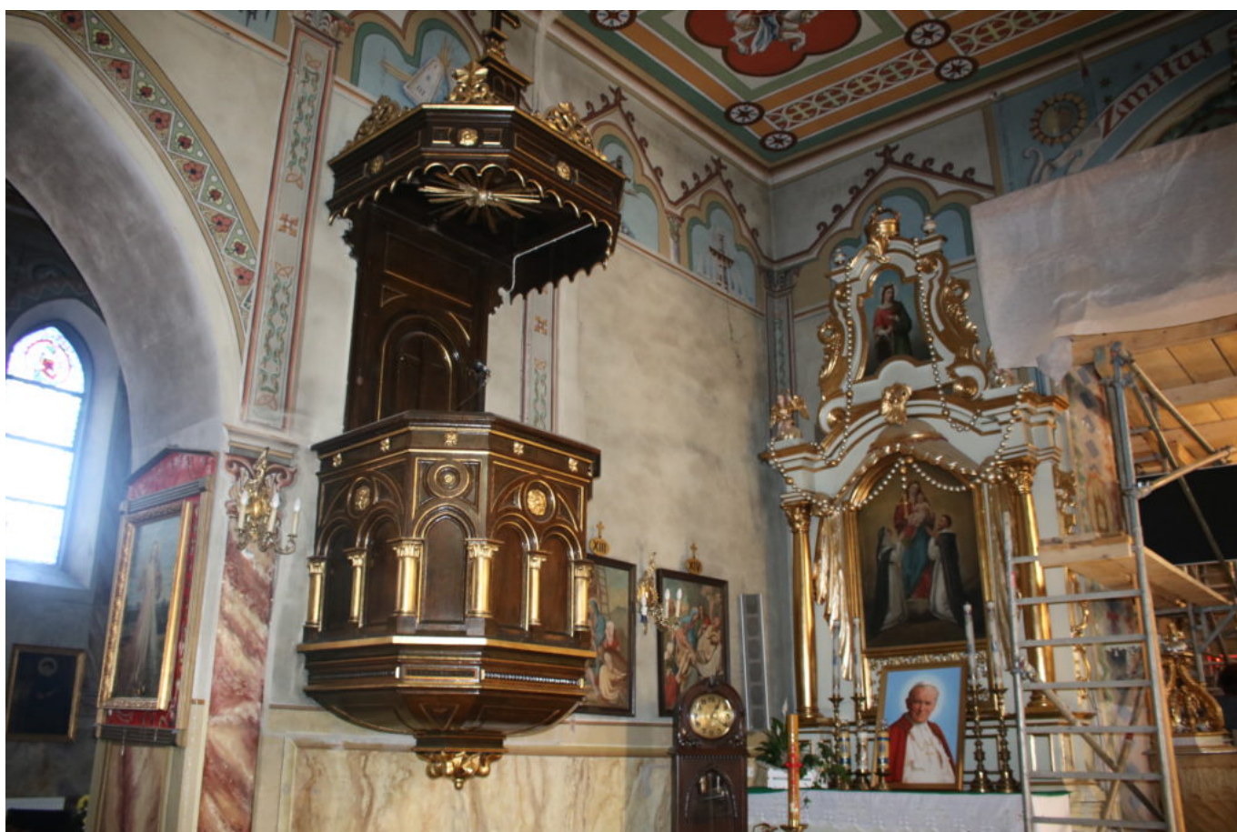
Parafia pw. Matki Boskiej Bolesnej w Limanowej