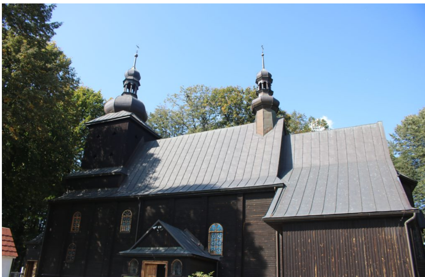
Parafia pw. Św. Mikołaja Biskupa w Skrzydłnej,