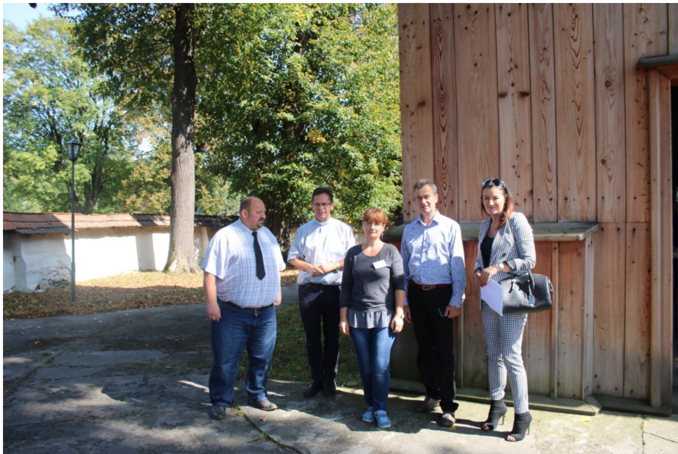
Parafia pw. Św. Marii Magdaleny w Kasinie Wielkiej