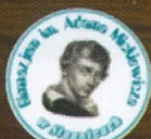
Gimnazjum im. Adama Mickiewicza w Słopnicach