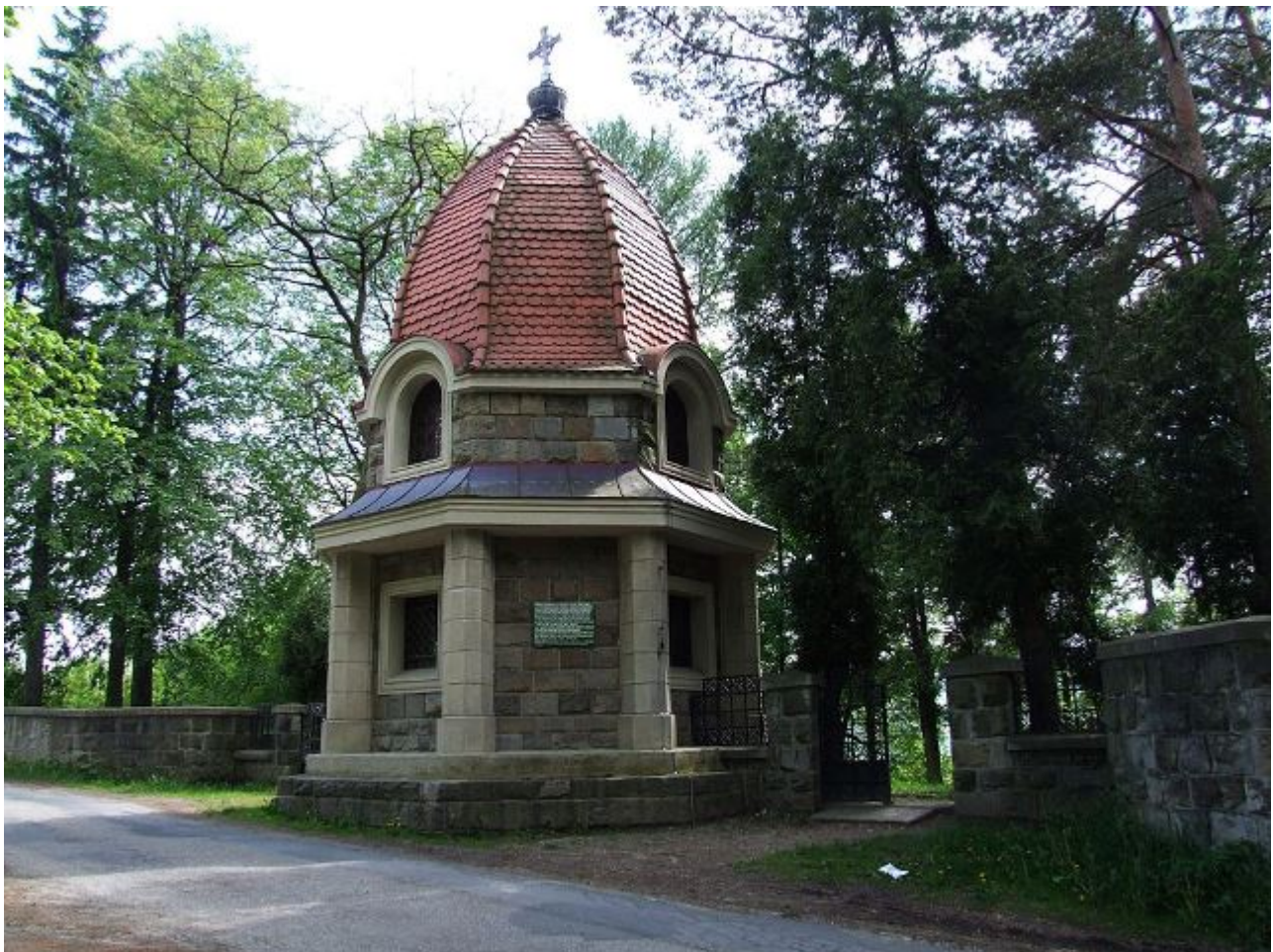
Cmentarz wojenny nr 369 – Stara Wieś-Golców – pochodzący z