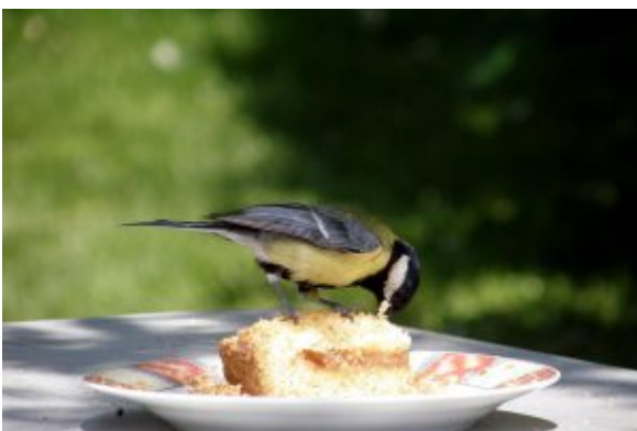
OLYMPUS DIGITAL CAMERA