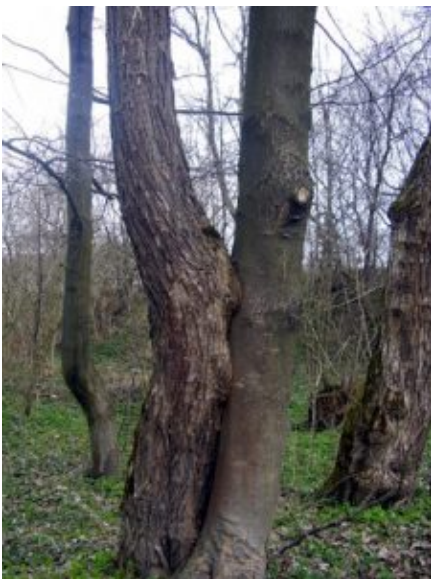
OLYMPUS DIGITAL CAMERA