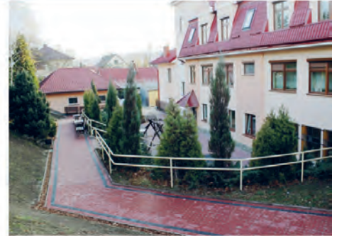
remont placów i chodników