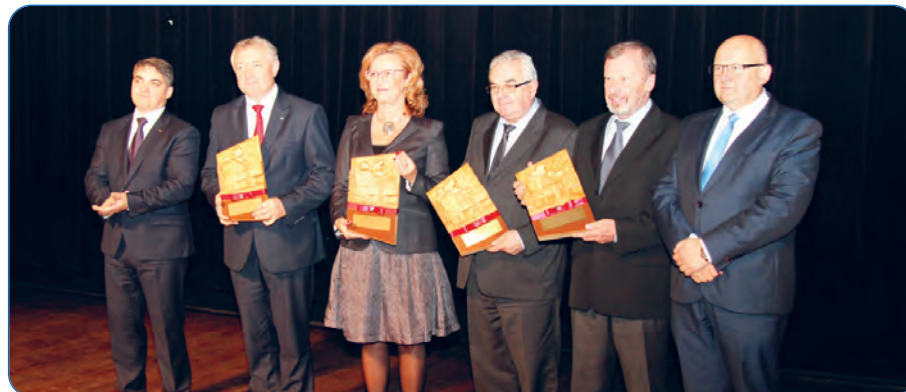
fot. Podziękowania za wsparcie w działaniach na rzecz limanowskiego szpitala i Służby Zdrowia.

Dziś, jako Poseł RP, ugrupowania rządzącego, chciałbym ściągnąć tutaj jak najwięcej oczekiwanych inwestycji, na które pieniądze muszą iść prosto z budżetu Państwa. Ważne będą inwestycje przebudowy dróg krajowych i dróg lokalnych. Nie zapominam o budowie obwodnic Limanowej i Mszany Dolnej, będę zabiegał o urealnienie kosztów tych inwestycji i ich podejmowanie. Będę też zabiegał o linię kolejową z Krakowa do Limanowej. A także modernizację drogi do Brzeska, aby stała się lepszą arterią