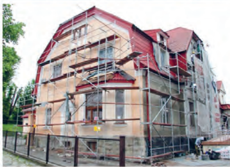
DPS Limanowa przed