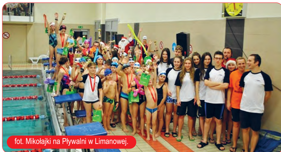
fot. Mikołajki na Pływalni w Limanowej.

Pływalnia Limanowska już na dobre wpisała się w krajobraz infrastruktury sportowej i rekreacyjnej Powiatu Limanowskiego. Obiekt zlokalizowany przy ul. Zygmunta Augusta 37 w Limanowej, w skład którego wchodzi kryty basen (dwie niecki, jacuzzi, rura zjazdowa), kręgielnia, sala fitness, squash, bilard oraz siłownia i restauracja jest jedynym tego typu na ziemi limanowskiej.