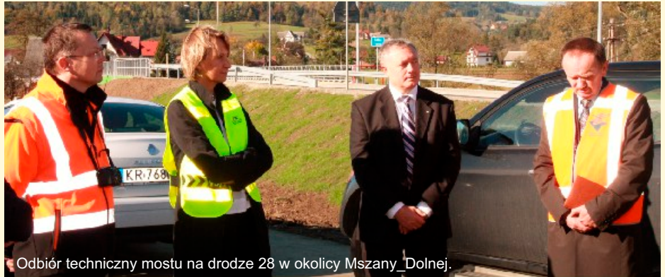
Odbiór techniczny mostu na drodze 28 w okolicy Mszany_Dolnej.

Każdy obywatel musi pamiętać, że realną jest próbą postawienia go w sytuacji rolnika, który ogląda niekończący się serial, albo turniej w telewizji na kolorowym ekranie i nie ma czasu wyjść do kurnika, gdzie lis zabiera mu kury. Nie mogę się oprzeć takiemu skojarzeniu kiedy muszę walczyć z zakusami wyprzedzaży Polskich Kolei Linowych w Zakopanem, Elektrowni w Niedzicy, Uzdrowiska w Wysowej! Ale i z rosnącym zadłużaniem.