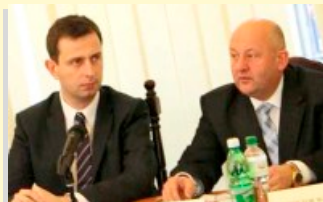
Spotkanie z Ministrem Pracy i Polityki Społecznej