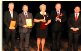
Liderzy Biznesu nagrodzeni