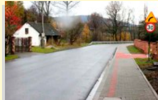
Schetyńówka już oddana