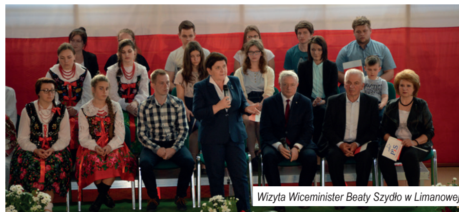
Wizyta Wiceminister Beaty Szydło w Limanowej

Było też wystarczająco dużo czasu, aby powiedzieć o naszych lokalnych planach budowy kolei i lepszych połączeniach lokalnych i do Krakowa.