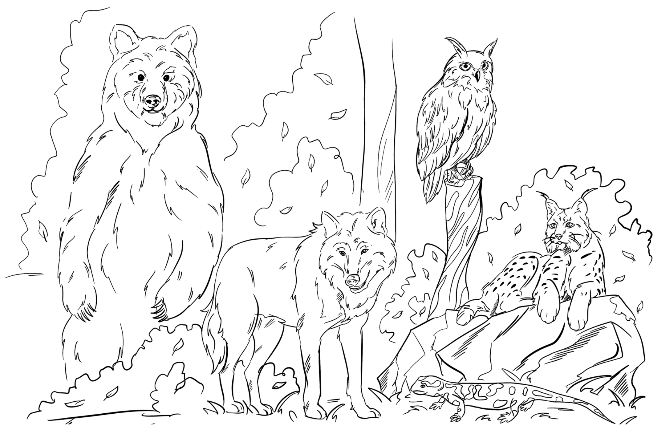
Faunę Gorczańskiego Parku Narodowego stanowi wiele gatunków chronionych