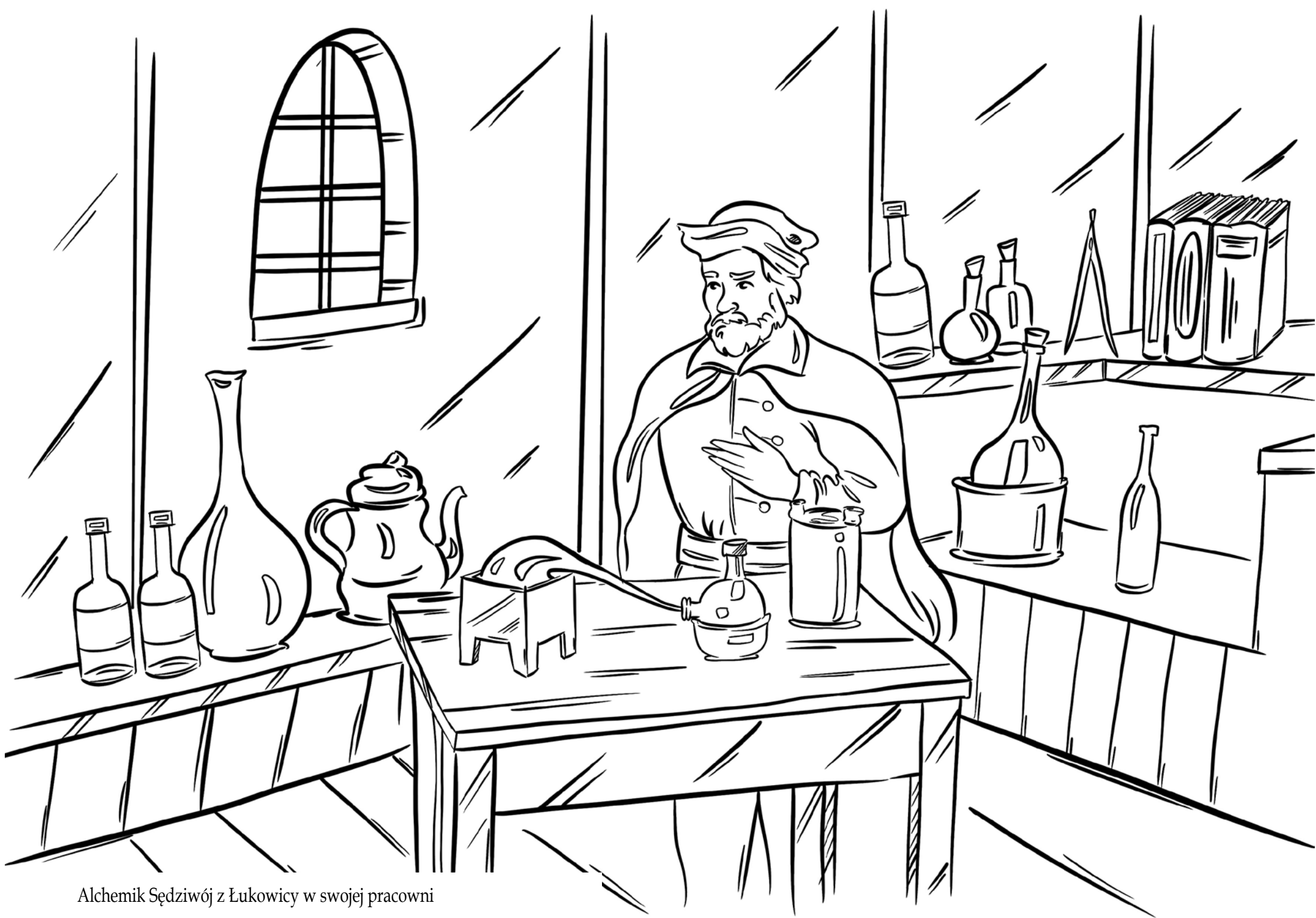
Alchemik Sędziwój z Łukowicy w swojej pracowni