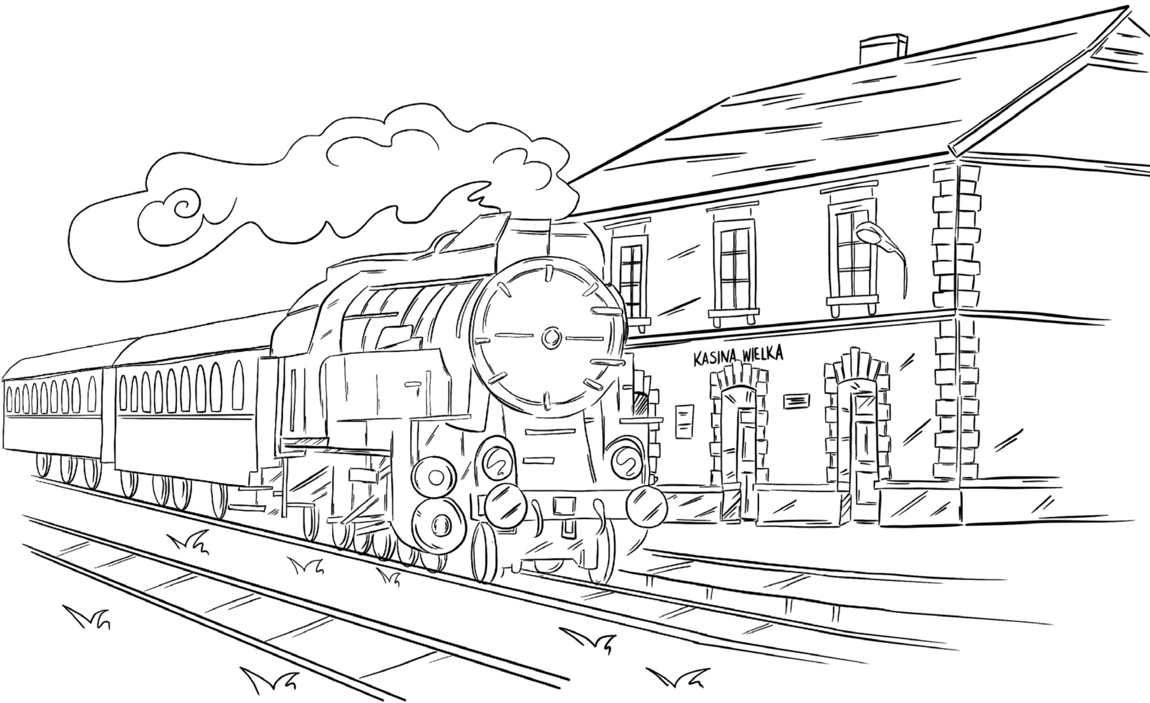
Pociąg Retro wjeżdża na stację w Kasinie Wielkiej