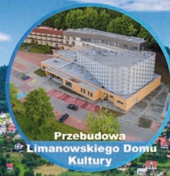
Przebudowa Limanowskiego Domu Kultury