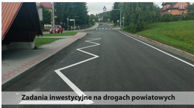
Zadania inwestycyjne na drogach powiatowych

Jednym z ważnych aspektów działalności Powiatu Limanowskiego było podejmowanie działań związanych z poprawą warunków komunikacyjnych i bezpieczeństwa poprzez kontynuację i wykonanie zadań inwestycyjnych na drogach powiatowych. Realizacja zakładanych zamierzeń w tym obszarze była możliwa dzięki pozyskanym przez Zarząd Powiatu znacznym środkom finansowym z bud-