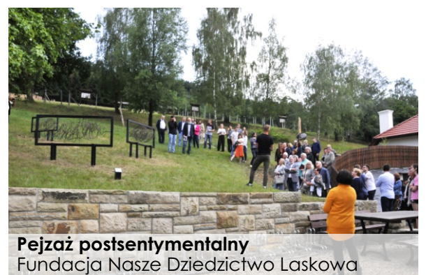
Pejzaż postsentymentalny Fundacja Nasze Dziedzictwo Laskowa