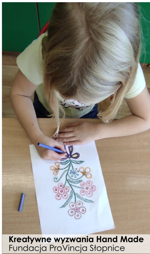
Kreatywne wyzwania Hand Made Fundacja ProVincja Stopnice