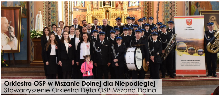
Orkiestra OSP w Mszanie Dolnej dla Niepodległej Stowarzyszenie Orkiestra Dęta OSP Mszana Dolna