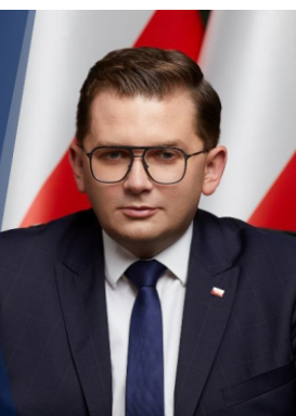
Łukasz Kmita WOJEWODA MAŁOPOLSKI