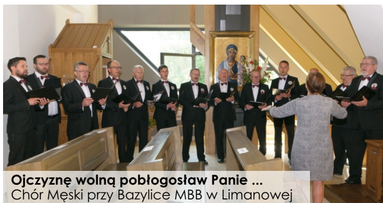
Ojczyznę wolną pobłogosław Panie ... Chór Męski przy Bazylice MBB w Limanowej