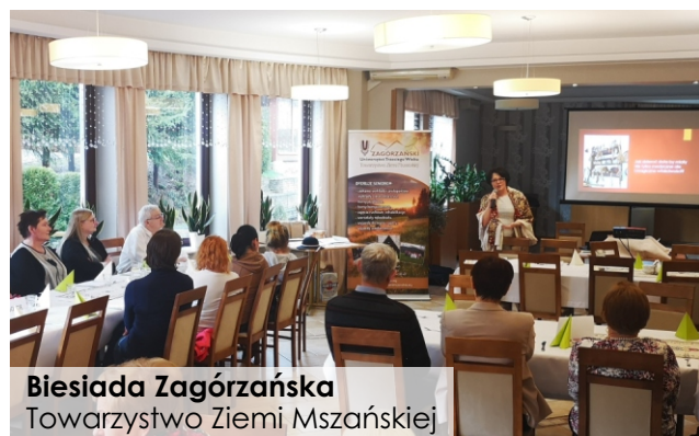
Biesiada Zagórzeńska Towarzystwo Ziemi Mszańskiej