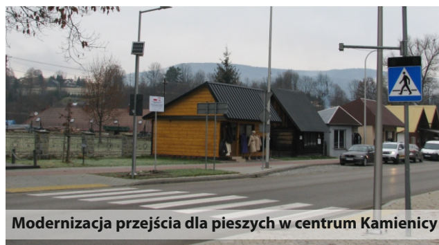
Modernizacja przejścia dla pieszych w centrum Kamienicy

- zakończenie przebudowy i remontu drogi powiatowej w miejscowościach Łostówka-Wilczyce-Jurków-Dobra (odcinek 12 km), remont drogi Rupniów-Nowe Rybie-Szyk (odcinek 5,2 km), stabilizacja osuwiska w Jurkowie, odcinkowa przebudowa drogi Strzeszyce-Kamionka Mała (3,7 km).- pozostałe roboty na dalszych odcinkach drogi Ujanowice-Laskowa będą kontynuowane w roku przyszłym, przebudowa obiektu mostowego w Zbludzy wraz z dojazdami na długości 0,7 km, budowa wspólnie z gminami nowych chodników w miejscowościach Stronie, Porąbka, Zamieście w kierunku Słopnic, Łostówka, Wilczyce, czy przebudowę drogi w m. Łukowica „Czartowska”.