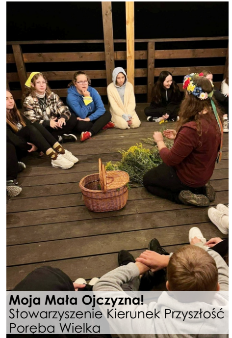
Moja Mała Ojczyzna! Stowarzyszenie Kierunek Przyszłość Poreba Wielka