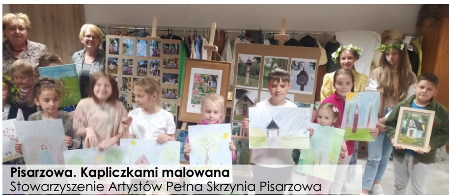
Pisarzowa. Kapliczkami malowana Stowarzyszenie Artystów Pełna Skrzynia Pisarzowa