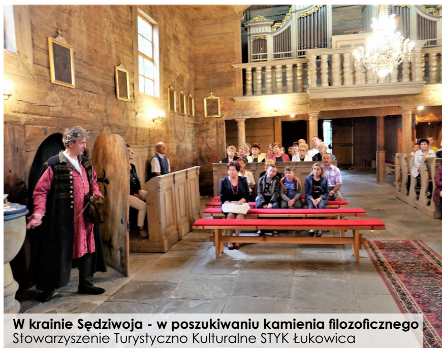
W krainie Sędziwoja - w poszukiwaniu kamienia filozoficznego Stowarzyszenie Turystyczno Kulturalne STYK Łukowica