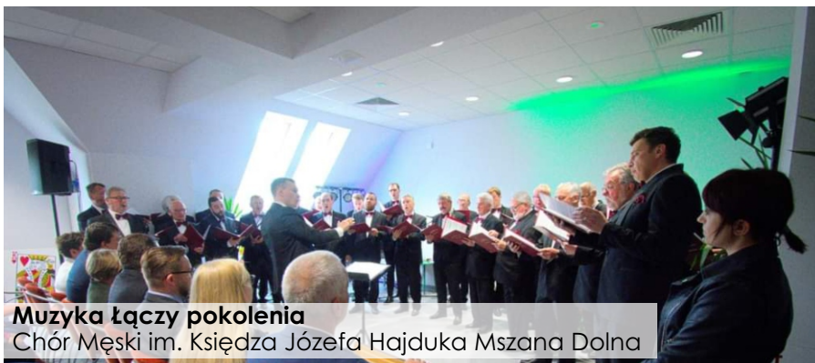
Muzyka łączy pokolenia Chór Męski im. Księdza Józefa Hajduka Mszana Dolna