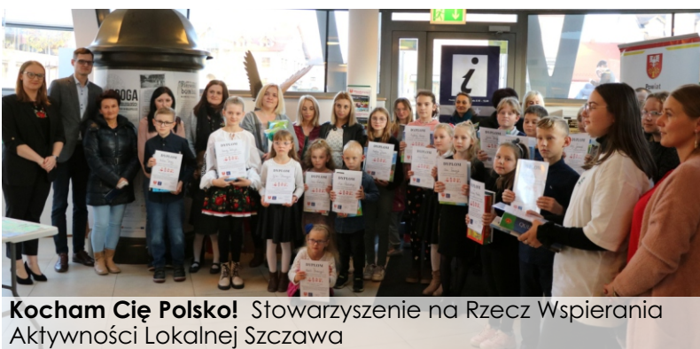
Kocham Cię Polsko! Stowarzyszenie na Rzecz Wspierania Aktywności Lokalnej Szczawa