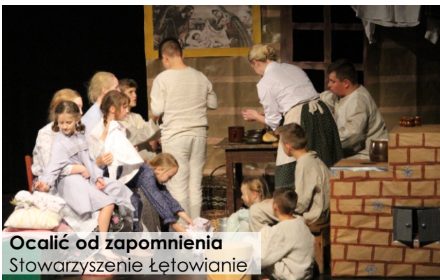
Ocalić od zapomnienia Stowarzyszenie Łętowanie