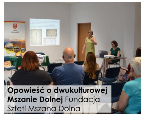
Opowieść o dwukulturowej Mszanie Dolnej Fundacja Sztetl Mszana Dolna