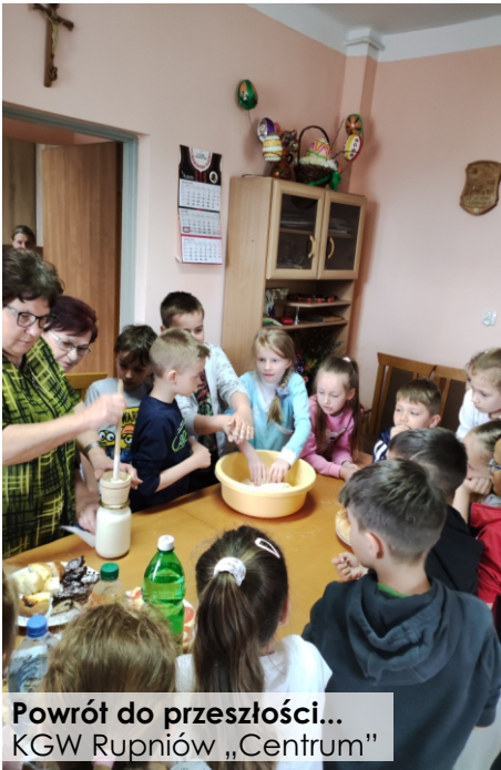
Powrót do przeszłości... KGW Rupniów „Centrum”