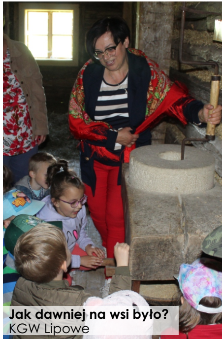
Jak dawniej na wsi było? KGW Lipowe