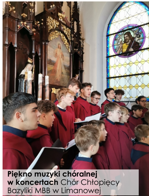
Piękno muzyki chóralnej w koncertach Chór Chtëpiący Bazyliki MBB w Limanowej