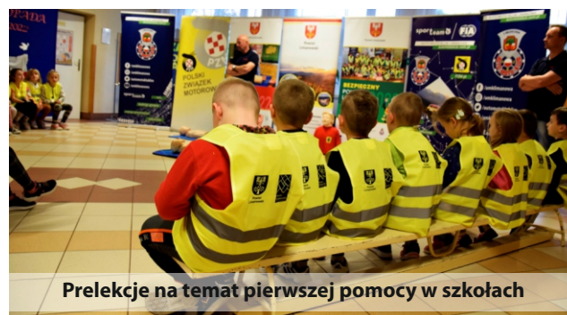
Prelekcje na temat pierwszej pomocy w szkołach

W tematyce bezpieczeństwa nie sposób nie wspomnieć o realizowanej w tym roku modernizacji systemu ostrzegania i alarmowania, polegającej na zakupie sprzętu - syren akustycznych, do budynków remiz OSP na terenie powiatu. Do programu przystąpiło 5 gmin.