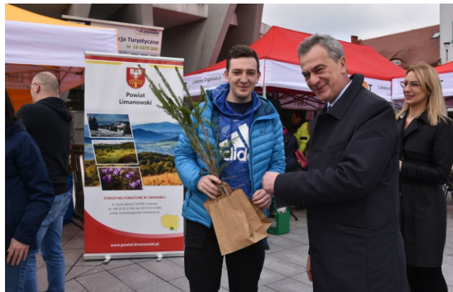
Kampanie informacyjno-edukacyjne w ramach realizacji Projektu LIFE-IP EKOMAŁOPOLSKA „Wdrażanie Regionalnego Planu Działania dla Klimatu i Energii”

gooszczędnych oraz 1800 szt.opakowań eko. Wszystkie wymienione przedmioty trafiły do mieszkańców Powiatu Limanowskiego podczas organizowanych akcji edukacyjno-informacyjnych.