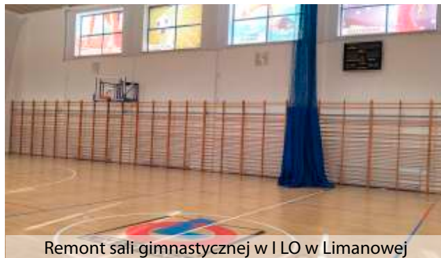
Remont sali gimnastycznej w I LO w Limanowej

W ramach zadania wykonano w szczególności wymianę stolarki okiennej i drzwiowej, wymianę podłogi, odmalowanie ścian sali, wymianę osprzętu sportowego, wymianę oświetlenia na energooszczędne, remont wentylacji.