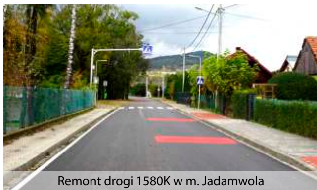
Remont drogi 1580K w m. Jadamwola