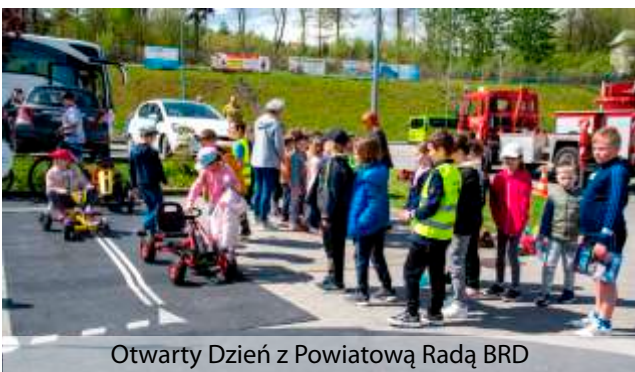
Otwarty Dzień z Powiatową Radą BRD