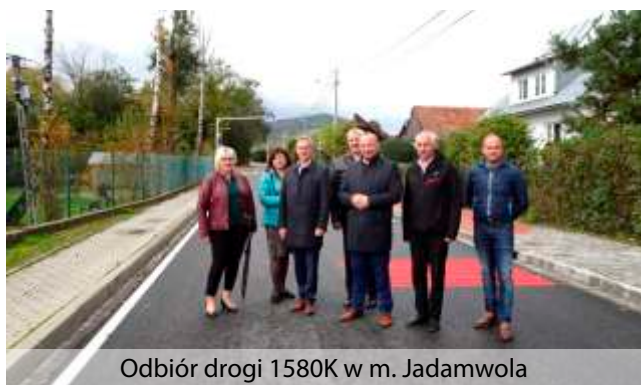
Odbiór drogi 1580K w m. Jadamwola