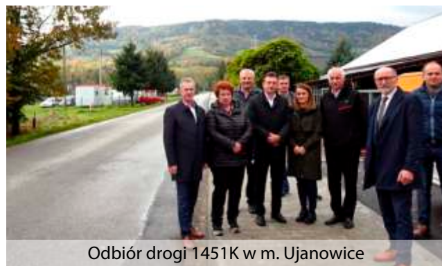
Odbiór drogi 1451K w m. Ujanowice

Zakres zadania pn. „Przebudowa drogi powiatowej nr 1451K Wojakowa – Sechna – Ujanowice w km od 7+482 do km 8+070 w miejscowości Ujanowice, Powiat Limanowski” – od skrzyżowania z drogą powiatową nr 1555K w kierunku Sechny obejmował: wykonanie odwodnienia – kanalizacji opadowej, chodnika na długości 473 mb, zjazdów, utwardzenie kruszywem pobocza wraz z krawężnikiem na długości 97 mb, poszerzenie bitumiczne jezdni, oznakowanie drogowe tzw. radar, zamontowanie barier zabezpieczających oraz utwardzenie placu postojowego na wysokości budynku OSP w Ujanowicach.