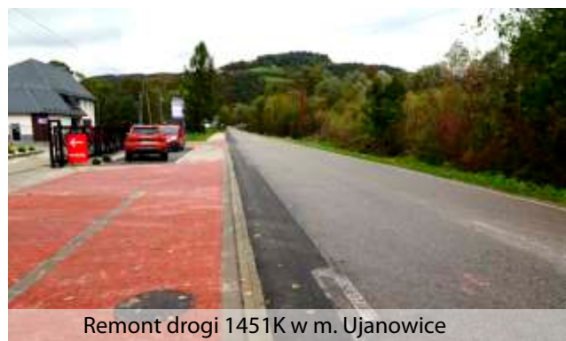
Remont drogi 1451K w m. Ujanowice

Drugie zadanie realizowane było w Gminie Laskowa przy wykorzystaniu środków finansowych pozyskanych z Rządowego Funduszu Rozwoju Dróg - 2023.