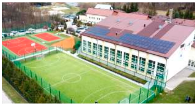
Kompleks boisk sportowych przy ZSTI w Mszanie Dolnej

W ostatnich latach na rynku pracy można zaobserwować nasilający się trend zapotrzebowania na pracowników o specjalistycznych umiejętnościach. Zbudowanie mocnej bazy edukacyjnej w szkołach średnich jest więc podstawowym zadaniem samorządu powiatowego. Realizując podjętą misję samorząd powiatu w 2023 r. dzięki pozyskanemu dofinansowaniu z Programu Sportowa Polska oddał do użytku kompleks boisk wraz z ich oświetleniem przy Zespole Szkół Techniczno-Informatycznych oraz boiska wielofunkcyjnego wraz z oświetleniem przy Zespole Szkół Ponadpodstawowych w Mszanie Dolnej. Koszt zadania wyniósł 2,3 mln zł.