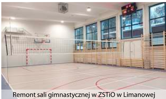
Remont sali gimnastycznej w ZSTiO w Limanowej