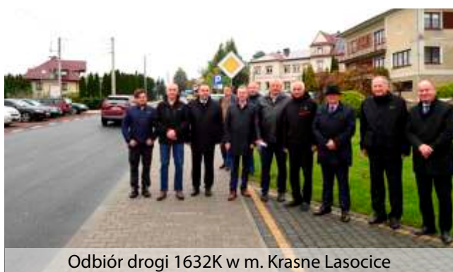
Odbiór drogi 1632K w m. Krasne Lasocice

poprzez położenie nowej nawierzchni bitumicznej wraz z oznakowaniem na ogólnej długości 835 mb.