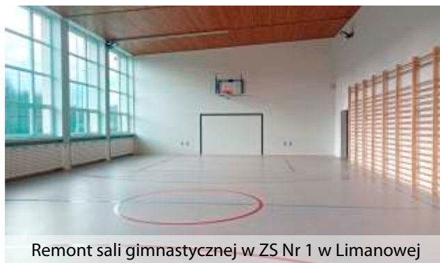
Remont sali gimnastycznej w ZS Nr 1 w Limanowej