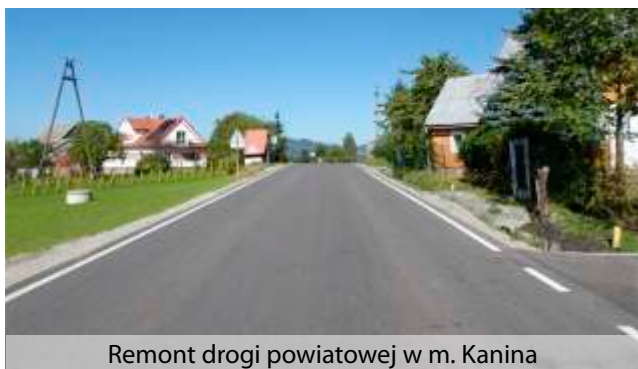
Remont drogi powiatowej w m. Kanina

Powiat Limanowski w trosce o poprawę jakości dróg oraz bezpieczeństwa wszystkich ich użytkowników, przeznaczając na ten cel znaczną część budżetu. W ostatnim czasie wzrosty cen surowców i usług spowodowały zwiększenie zaplanowanych wydatków. Taka sytuacja pociąga za sobą konieczność podjęcia trudnych, ale poprzedzonych dokładną analizą, decyzji. Niemniej, osiągnięcie nadrzędnego celu - komfort użytkowania dróg powiatowych został osiągnięty. Łącznie w 2023 r. zmodernizowane zostało ponad 17 km powiatowej infrastruktury drogowej, które obejmowało odcinkowe położenie nowej nawierzchni bitumicznej wraz z wzmocnieniem geosiatką, wykonanie odwodnień, przebudowę chodników (6 km) i poboczy, przebudowę 3 przepustów, modernizację 8 przejść dla pieszych wraz z wprowadzeniem oświetlenia dedykowanego, montaż nowego oznakowania drogowego, jak również utwardzenie ścieżek, budowę oświetlenia drogowego i wykonanie punktów wypoczynkowych na szlaku od Centrum Obsługi Ruchu Turystycznego w Zalesiu w kierunku góry Mogielica. Łączny koszt tych inwestycji wyniósł ok. 52 mln zł i w znacznej części (38 mln zł) pokryty został ze środków zewnętrznych pozyskanych z: Rządowego Funduszu Rozwoju Dróg, Programu Inwestycji Strategicznych Polski Ład, Funduszu Leśnego oraz partnerów lokalnych jednostek samorządu terytorialnego.