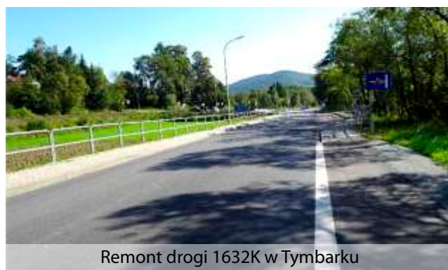
Remont drogi 1632K w Tymbarku