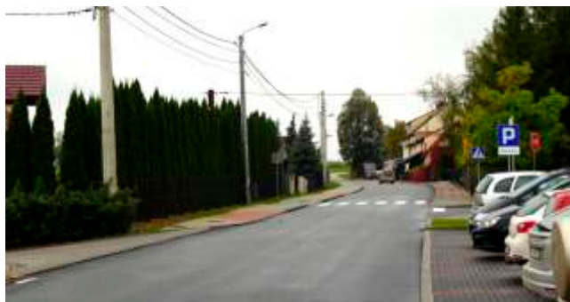
Remont drogi 1632K w m. Krasne Lasocice

3. wykonanie odcinkowego remontu drogi powiatowej nr 1622K relacji Dąbie - Szczyrzyc - Dobra w miejscowości Szczyrzyc rejon koło szkoły podstawowej oraz odcinek od wysokości Opactwa Cystersów w kierunku Pogorzan,