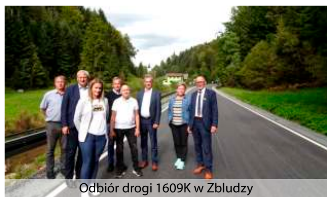
Odbiór drogi 1609K w Zbludzy

Zadanie podzielono na 4 zadania częściowe w ramach których wykonano: remont drogi powiatowej w miejscowościach Kanina/Przyszowa (począwszy od DK 28 do mostu w „Berdychowcu”), Stronie (pogranicze z Powiatem Nowosądeckim w kierunku Mokrej Wsi), Łukowica i Tymbark. Zagospodarowanie turystyczne szlaku łączącego Centrum Obsługi Ruchu Turystycznego w Zalesiu z parkingiem przy trasach w kierunku góry Mogielica poprzez wykonanie oświetlenia oraz infrastruktury turystycznej. Remont drogi powiatowej w miejscowości Koszary (od granicy z Limanową do granicy z Piekiełkiem), Tymbark (od Podłopienia do skrzyżowania w kierunku Piekiełka), Porąbka (od przystanku BUS powyżej torów kolejowych w kierunku Skrzydłnej), Dobra (od DK 28 do mostu) i Kamieica/Zbludza. Wyremontowano również drogę powiatową w miejscowościach Zalesie/Zbludza, Poręba Wielka (w kierunku Koninek od mostu do wysokości Kościoła), Niedźwiedź (od osiedla Spyrki do Szkoły Podstawowej) i Szczyrzyc (centrum).