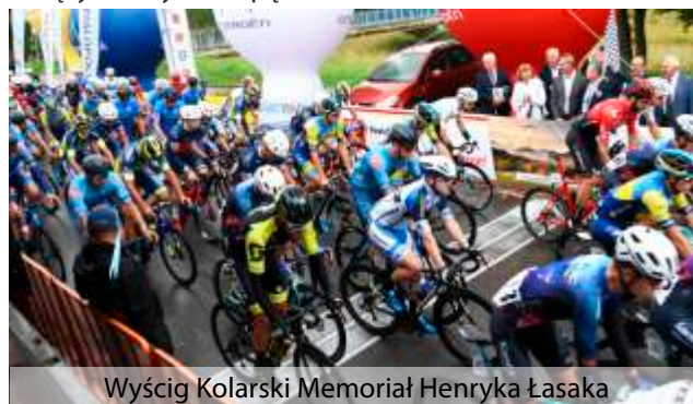
Wyścig Kolarski Memoriał Henryka Łasaka

Z roku na rok Powiat Limanowski zyskuje popularność jako miejsce organizacji licznych wydarzeń sportowych o zasięgu regionalnym, ogólnopolskim, a nawet międzynarodowym. Mając świadomość potencjału malowniczego Beskidu Wyspowego i Gorców jak i możliwości turystycznych regionu, Powiat Limanowski wspiera organizację prestiżowych imprez sportowych takich jak 14. Wyścig Górski Limanowa - Przełęcz pod Ostrą czy 25. Międzynarodowy Wyścig Kolarski Memoriał Henryka Łasaka, które przyciągają do powiatu rzesze miłośników sportu jak również turystów chcących aktywnie spędzić czas.