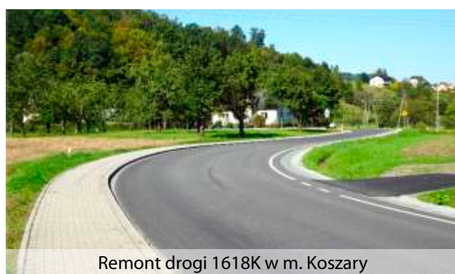
Remont drogi 1618K w m. Koszary